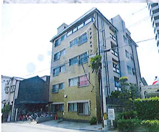
●室内写真と現況が異なる場合は、現況を優先させていただきます。